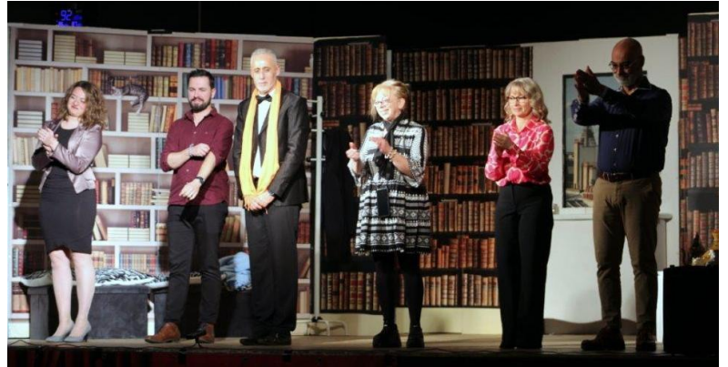
C'est la 6 ème représentation théâtrale des "Phénomènes de Saint Alban" au profit d'Arémau