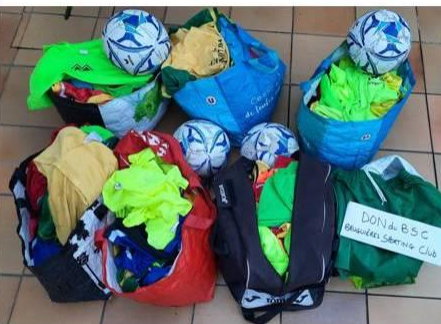
Don du club de foot de Bruguières