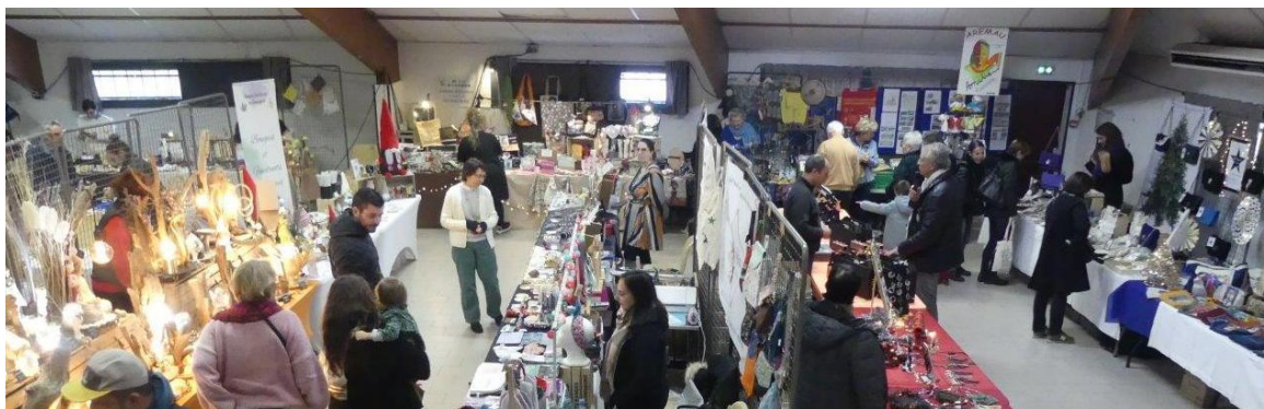
Ce marché de Noël a toujours autant de succès