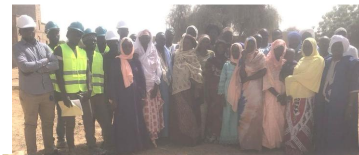
Cérémonie de lancement des travaux le 11 novembre 2023 :

Cette extension améliorera l'organisation du fonctionnement du jardin d'enfants par des espaces supplémentaires de travail ; de jeux et de stockage du matériel pédagogique. Elle permettra une plus grande capacité d'accueil d'enfants