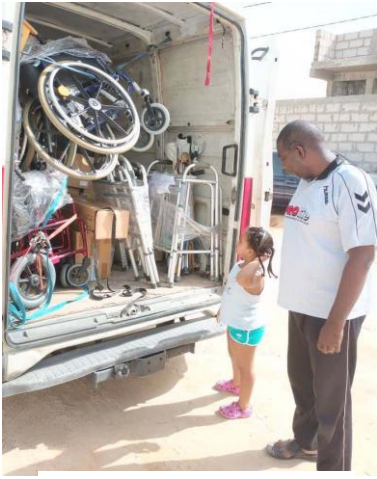
Livraison à Nouakchott