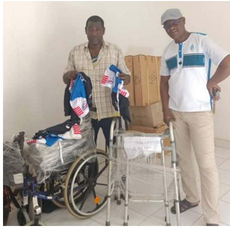
Ils sont Remis à l'ADEST : Association pour le Développement Economique et Social de Thialgou