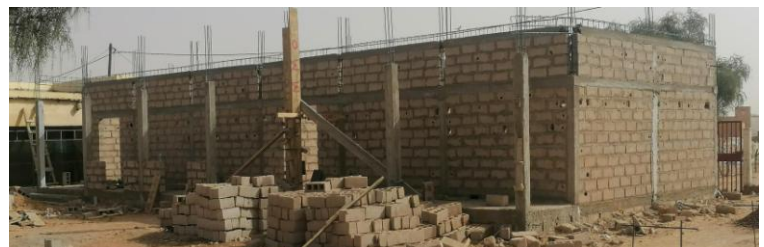
Chantier le 17 décembre 2023

Cette extension améliorera l'organisation du fonctionnement du jardin d'enfants par des espaces supplémentaires de travail ; de jeux et de stockage du matériel pédagogique. Elle permettra une plus grande capacité d'accueil d'enfants