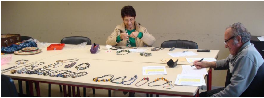
Préparation des articles à exposer