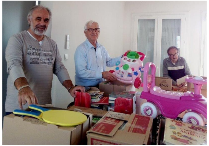
Sélection, réparation et classement des jouets et des livres à exposer