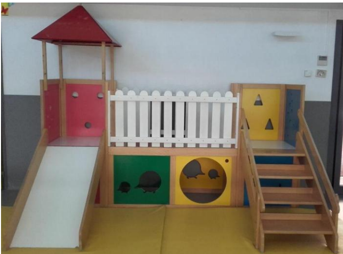
Avant son démontage à la crèche des Minimes de Toulouse

En raison de la pandémie, notre transporteur routier n'a plus la possibilité de se déplacer