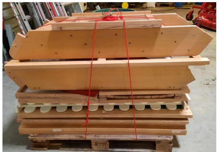
Stockage aux ateliers municipaux de Bruguières