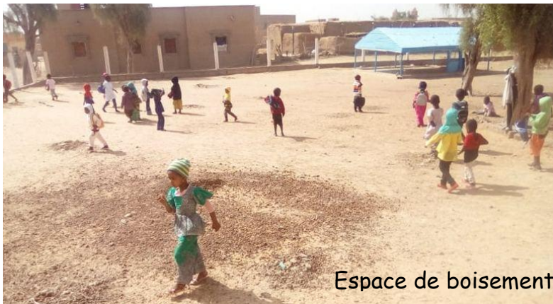
Espace de boisement