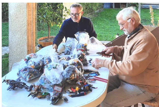
Tri de 12 kg de Légos !