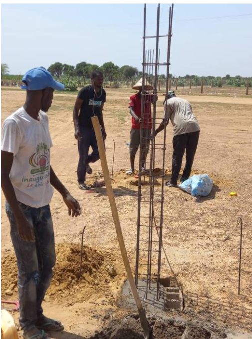
Construction de la clôture