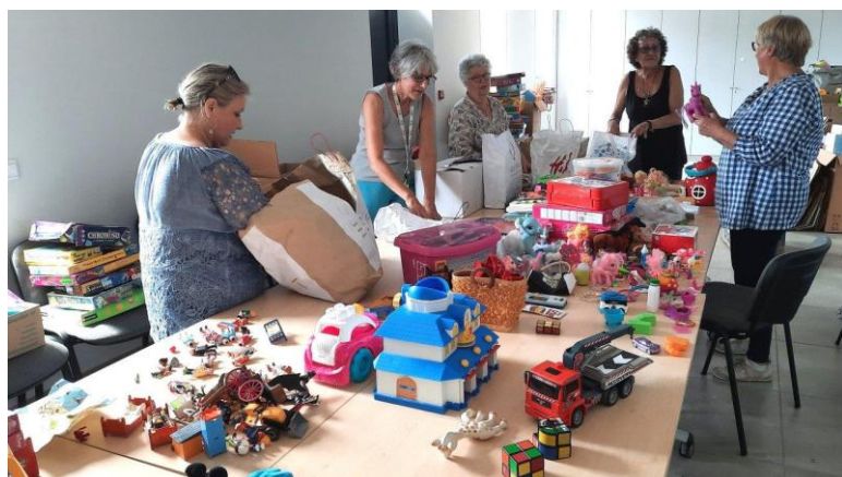
Toute une équipe au travail à l'Espace Nougaro de Bruguières